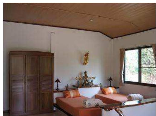
Bilder von oben links: Meditations-Sala / Master Han Sahn / Impressionen des Retreat-Geländes / Bungalow / Schlafzimmer